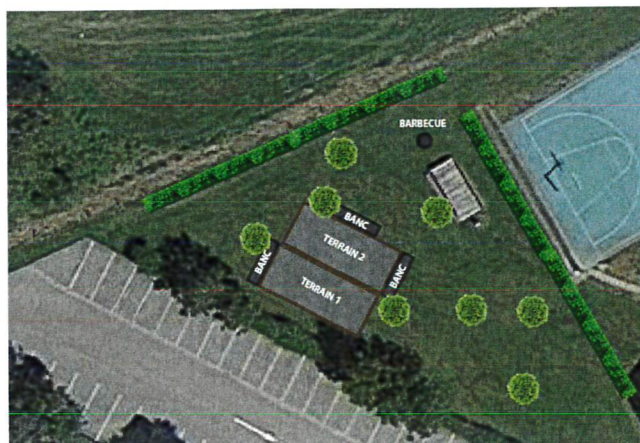
Illustration du Projet